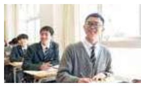
人間環境大学附属 岡崎高等学校