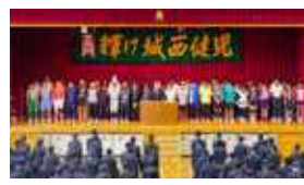
岡崎城西高等学校