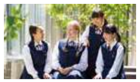
光ヶ丘女子高等学校