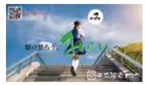
愛知産業大学 三河高等学校