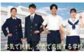
安城学園高等学校